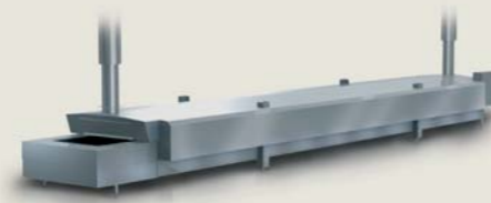
Tunnel fryser X1

SnoWin™ - Avanceret CO 2 teknologi serien består af såvel on-line som batch løsninger.