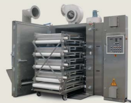
Multibelt Cabinet X9

*inklusive styreskab **inklusive ind- og udløb ***inklusive udsugningsventilator ****eksklusive udsugningsventilator